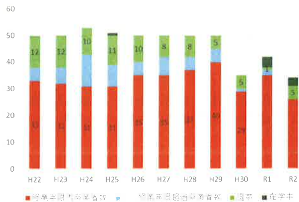
修業年限内退学率